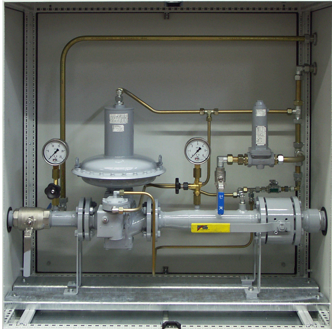
Схема регуляторного блока в стальном шкафу Технические изменения предусмотрены